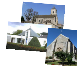
NOTRE PERE N°575