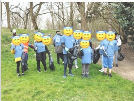
L'aumônerie 4/3 en action dans une Clean Walk

Les Young de L'Essonne sont nés en 2013 et participent à la lutte contre la pauvreté dans les différentes actions qu'ils mènent.