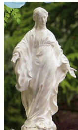
La Vierge au sourire

Ces animations ont été préparées par l'équipe « Thérèse 91 »