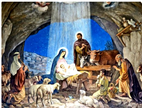
Bethléem, mosaïque dans la chapelle des bergers